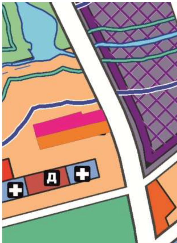
Фрагмент приложения «Схема использования территории (Опорный план)»