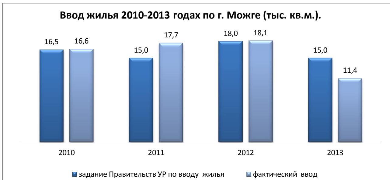
Таблица № 8