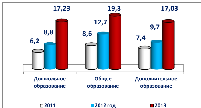
Таблица № 15

С 01 апреля 2013года на основании Постановления Правительства Удмуртской Республики от 29.04.2013г. №184 увеличена заработная плата помощникам воспитателей дошкольных образовательных учреждений на 10%. Также с 01 сентября 2013 года на основании Постановления Правительства Удмуртской Республики от 15 июля 2013 г. № 315 увеличена зарплата на 20 % педагогическим работника дошкольного общего и дополнительного образования, а с 01.10.13 г. на 5 % руководителям и другим категориям работающих.