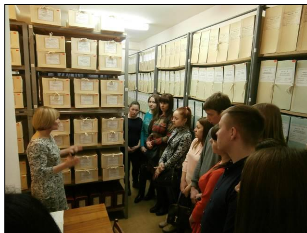
Студенты на экскурсии в архивохранилище 2017 г.