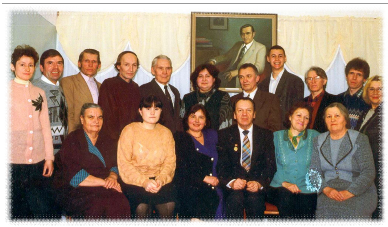
Члены поэтического клуба «Инвис» [2000-е] г.